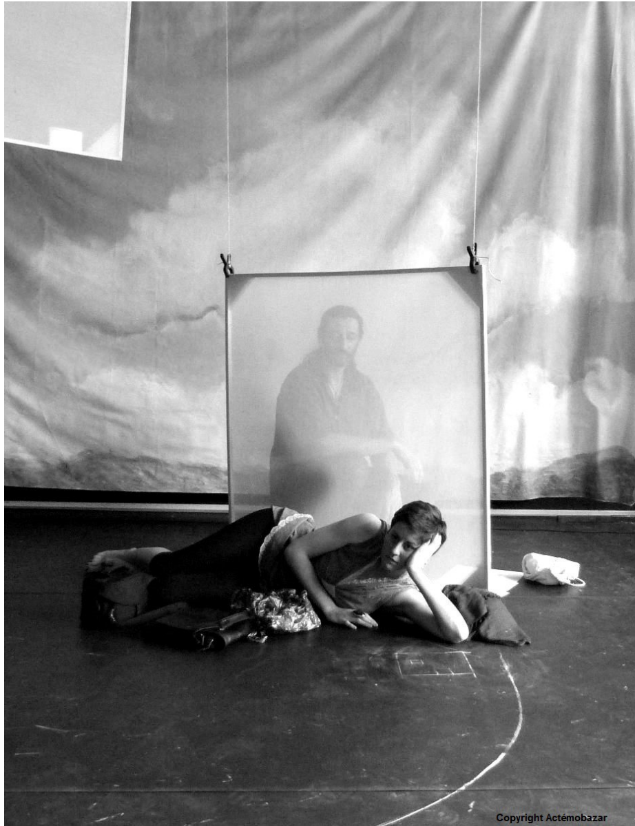
Photo de répétition