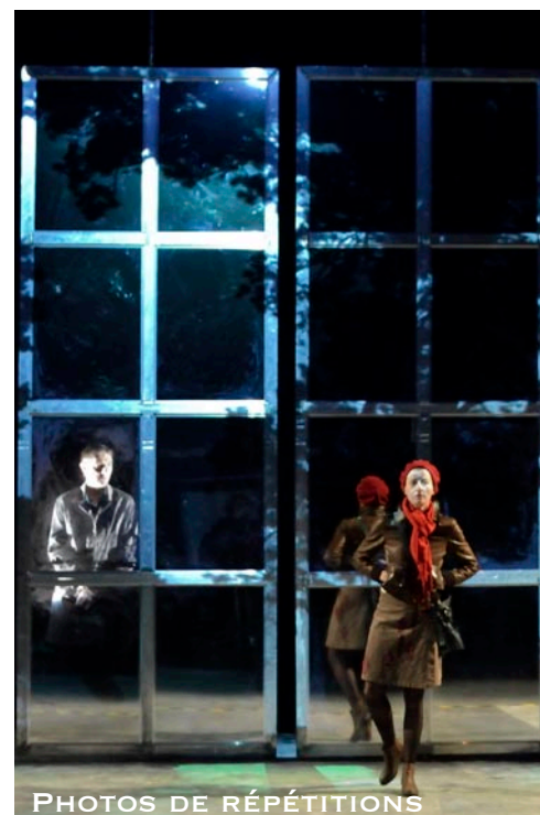
PHOTOS DE RÉPÉTITIONS

LE SON EST CONSTRUIT AUTOUR DES DEUX AXES PRINCIPAUX : L'USINE ET LA FORÊT. IL FAIT PERCEVOIR LA RESPIRATION ET LE RYTHME ORGANIQUE DES CES DEUX ENTITÉS QUI S'OPPOSENT.