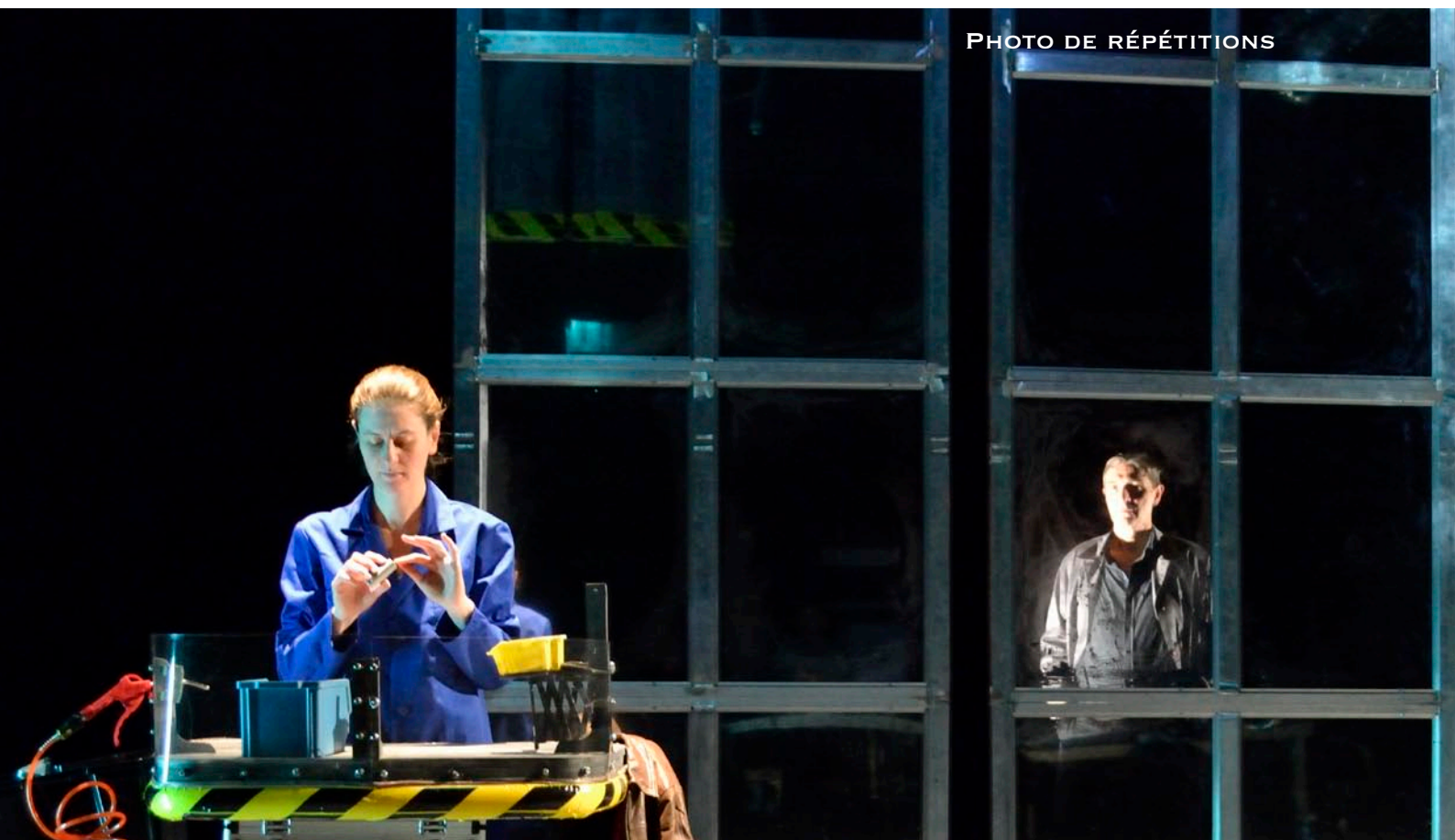
PHOTO DE RÉPÉTITIONS

LA PIÈCE TRAITE AUSSI DE LA DÉVOTION AU TRAVAIL, DE CETTE «ÉMANCIPATION» QUE CELUI-CI PROCURE À CÉCILE, PETITE MAIN DÉVOUÉE AU-DELÀ DU POSSIBLE, ALORS MÊME QU'ELLE S'ALIÈNE À SON ÉTABLI. LA RICHESSE DU TEXTE VIENT DE CE QU'IL POINTE LES PARADOXES DE NOTRE RAPPORT AU TRAVAIL : ENTRE ALIÉNATION ET ÉMANCIPATION, ENTRE DÉVOTION ET SACRIFICE.